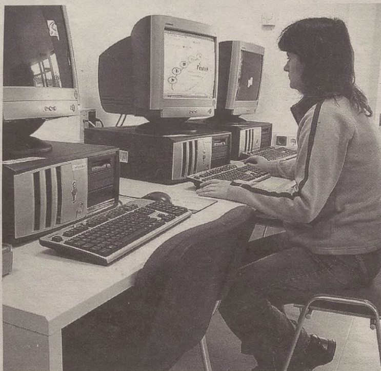
Udalaren eta herriaren gaineko informazio zabala jasoko du webguneak.

Kanpokoendako, berriz, beharbada interesgarriagoak izango dira herriko artea, historia eta jaien gaineko atalak, esate baterako.