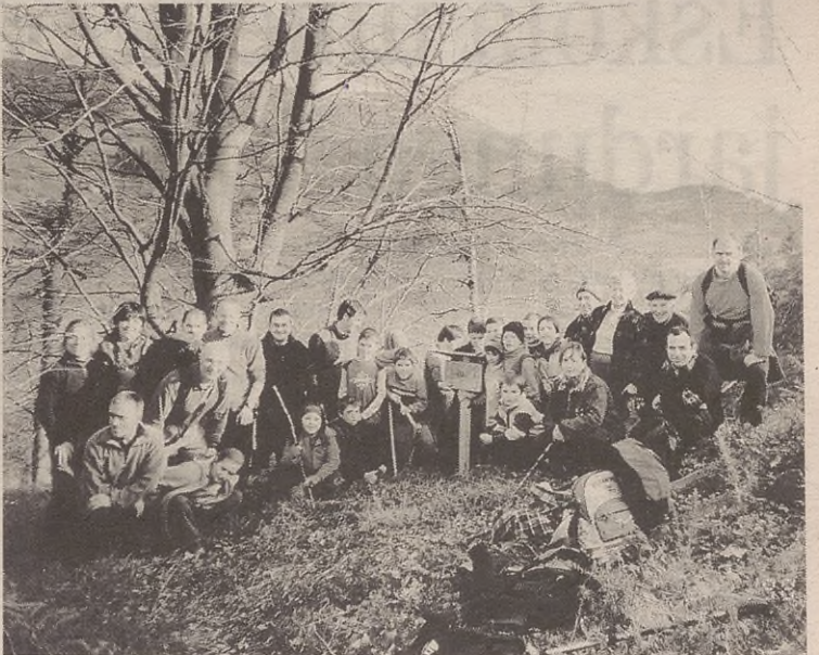
Arrolako mendizaleak, Pagape iturrian.

Datozen hilabeteotan ere hainbat irteera egongo dituzte: hala, azaroaren 9an egongo dute lehenengo irteera; Izarraitz aldeko mendietara joango dira, Erlotik Xoxotera, hain zuzen ere. Hurrengo azaroaren 23an egongo dute, Mixotik San Migelera, hain zuzen ere. Abenduan beste bi irteera egongo dituzte: hala, hilaren 14an, Kanpanzartik Udaltxera joango dira, eta 31n, ohi bezala, Aizkorriara joango dira, urtea ondo bukatzeko.