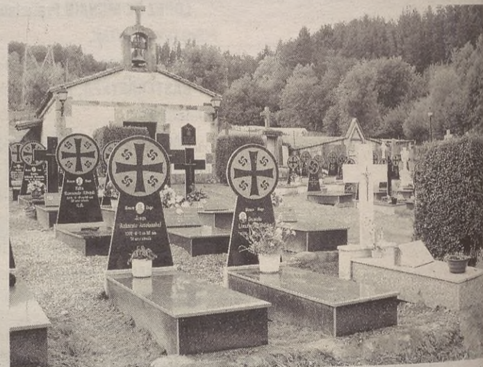
Astelehena ezkerreko zabalik dago hilerria, eta halaxe egongo da datorren astean ere.

Uzarragako hilerria ere zabalik egongo da Domu Santu egunean. Urtean barrena ere, normalean, zabalik egoten da auzo horretako hilerria.