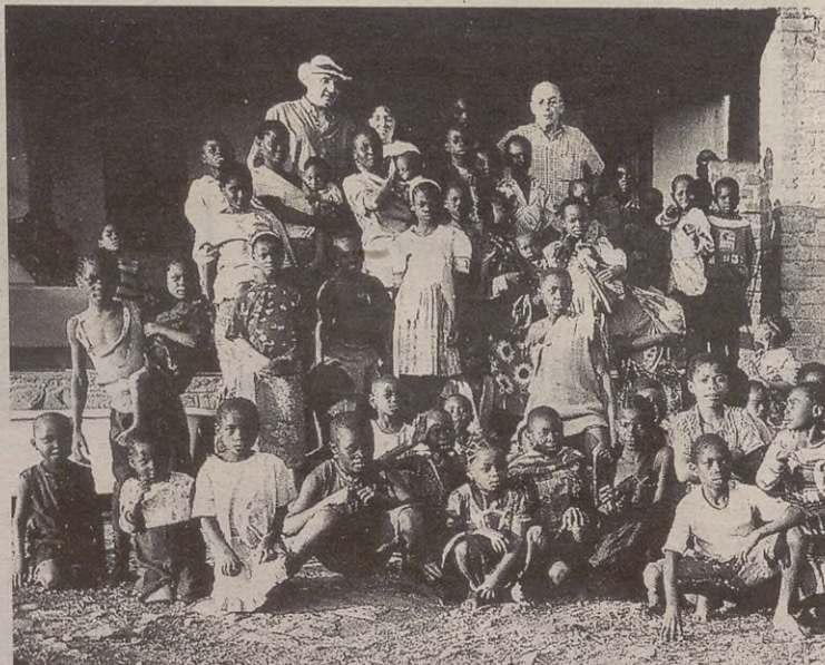
Azaro amaieran Kongoren gaineko argazki erakusketa antolatuko du Anelkarrek.

Hurrengo zapatuan, hilak 15, babarrun-jana egingo du Anelkarrek eta nahi duena joan daiteke. 20 euro ordaindu beharko dira eta txartelak liburu dendan eros daitezke. Bestalde, Antzuolako zenbait dendatan kaxak jarriko dira herritarrek Kongorako dirua uzteko.