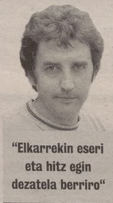
“Elkarrekin eseri eta hitz egin dezatela berriro”

Izan ere, nork nahi du hiru pertsonatik bat konpontzen ez den herri batean bizitzea? Zer gertatuko litzateke batek beste bie hitza ukatuko balie? Eta urteroko Mairuaren Alardean irteten diren etatik herenak ezetz esango baluke? Eta hirutik batek zergarik ordainduko ez balu? Eta horri erantzunez, giroa erabat