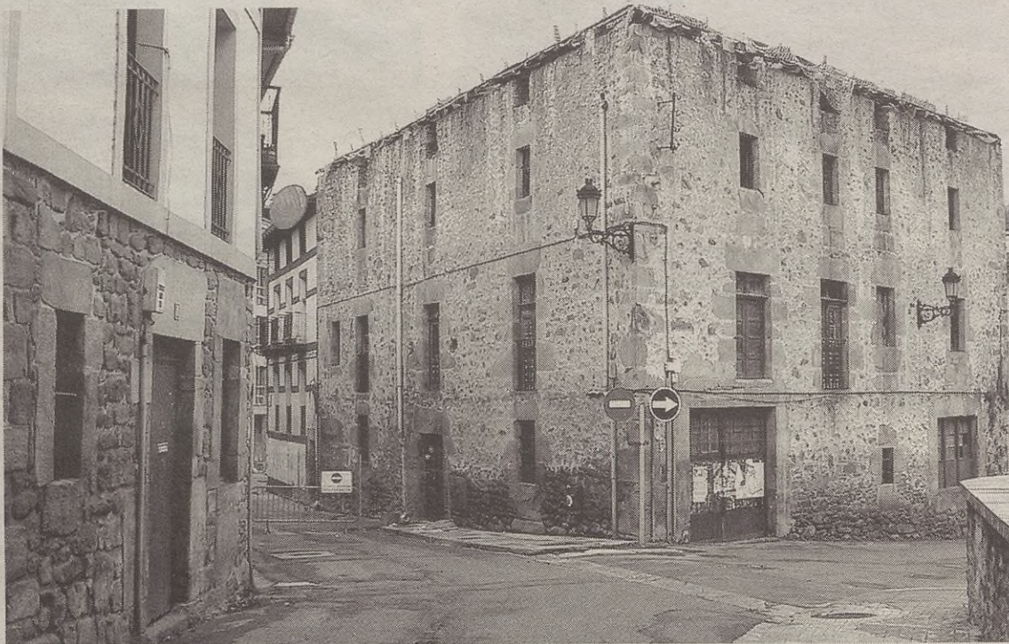
Talleres Antzuola Buztinzuriko lanak bukatu baino lehen botatzeko eskatu dio Udalak enpresa eraikitzaileari.

Txorikua etxea ere eraitsiko dute. Horrela, Kalegoi eta Sagasti elkartuko dituen errepidea egingo dute.