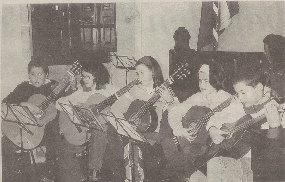
Musika Eskolako ikasleek kontzertua egingo dute martitzenean, 19:00etan, udaletxeko aretoan.

Klarineta, txistua, gitarra, flauta, oboea, soinua eta biolontxelo dira herriko gaztetxoek jotzen dituzten instrumentueta-