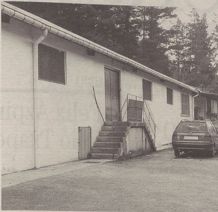
Hazitarako untxiak jarriko ditu Euskadiko Untxizainen Federazioak Antzuolan.

Euskadiko Federazioak dituen beste granja batzuetako untxi emeak intseminatuko dituzte Antzuolakoan haziarekin. Federaziotik kanpo ez dute zaltuko, ez hazirik, ezta untxirik ere. Juriñe Arroita Federazioko tek-