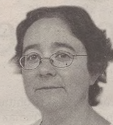
“Enpresak ere gehiago presionatu beharko genituzke”

Gizarte osoak, heziketa dela eta, asko presionatzen du eskola, baina uste dut enpresak ere gehiago presionatu behar ditugula, umeak ditugun garaian erraztasun gehiago izateko. Edadetuok