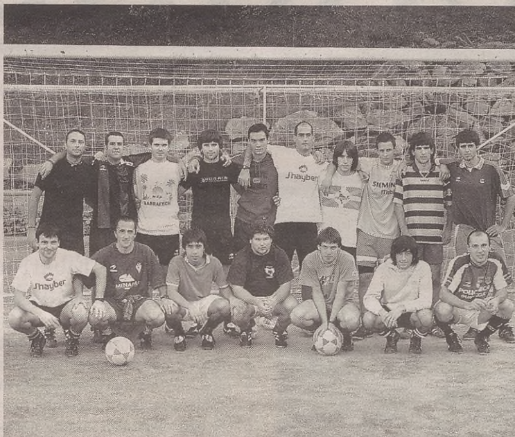
Erregional mailako taldeak igoera fasea jokatzen dihardu.

Gazte mailako taldeak, berriz, bigarren faseko lehen partidua