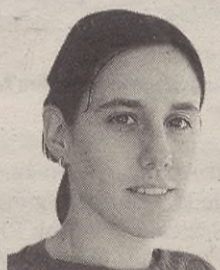
"Haur eskola ez da izango haurrak aparkatzeko leku bat"

Orain, hemendik gutxira "haurtzaindegia" jartzeko asmoa omen dago. Baina haurtzaindegia baino haur eskola deitzea egokiagoa iruditzen zait, ez baita izango haurrak aparkatzeko leku bat, edo behintzat, ez luke izan beharko. Haurrak hezteko leku bat izan beharko litzateke, hain zuzen