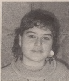
"Esaten digutena inongo zalantza izpirik sortu gabe irensten dugu"

neure buruari galdetzen diot honen zergatia zein ote den. Esaten digutena inongo zalantza izpirik sortu gabe irensten dugunaren ideia da niretzat sendoena. Telebista edo irratia piztu, egunkari bat zabaldu eta bertako informazioa beste-rik gabe sinisten dugu. Ez dugu idatzitakoa, ikusitakoa edo entzundakoa buruzko inongo zalantzarik, eta egiazat