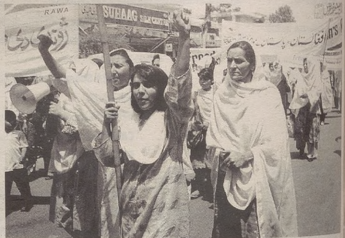
Afganistango emakume talde bat, manifestazio baten.

Bestalde, gai horrekin lotutako hitzaldia ere egingo dute; zurrerik, hilaren 11n, eguena, izango da hitzaldia, baina, baitezkezteke dute oraindik.