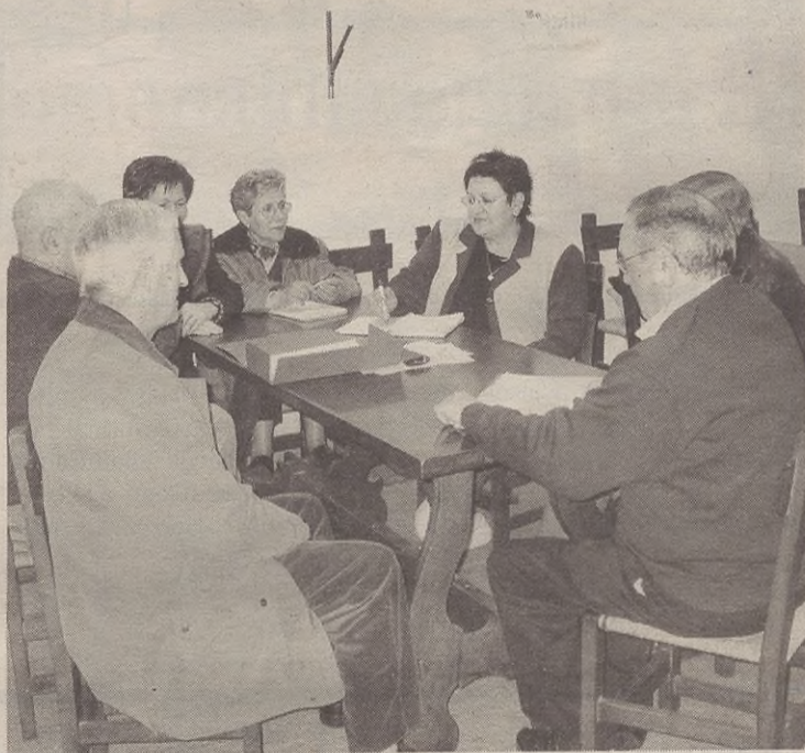
Erretiratuaren elkarteko batzordeko kideak, batzarrean.

Bestalde, behin betiko egoitza izango denari dagokionez, aipatzeak da laster hasiko direla proiektu hori egiten; horretarako, elkarlanean jardungo dute Udalak eta erretiratuek.