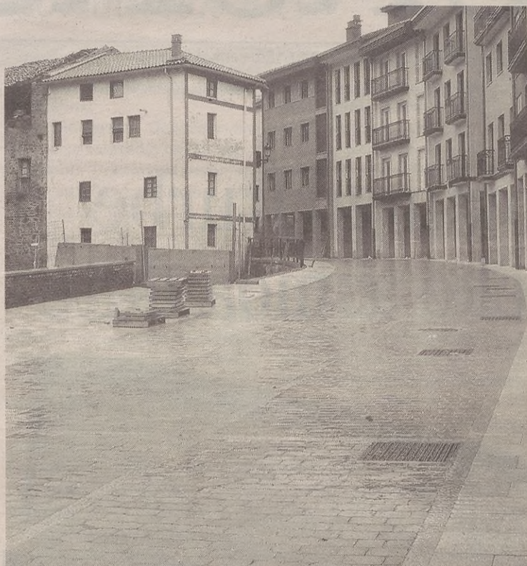
Buztinzuri kalean zoru berria jarri dute, galtzada-harriz.

Talleres Antzuola zegoen eraikina eta aldamenekoa eraberritu egin behar dituzte. Horretarako, aldazio handiak jarri beharko dituzte eta horrek trabak sortu