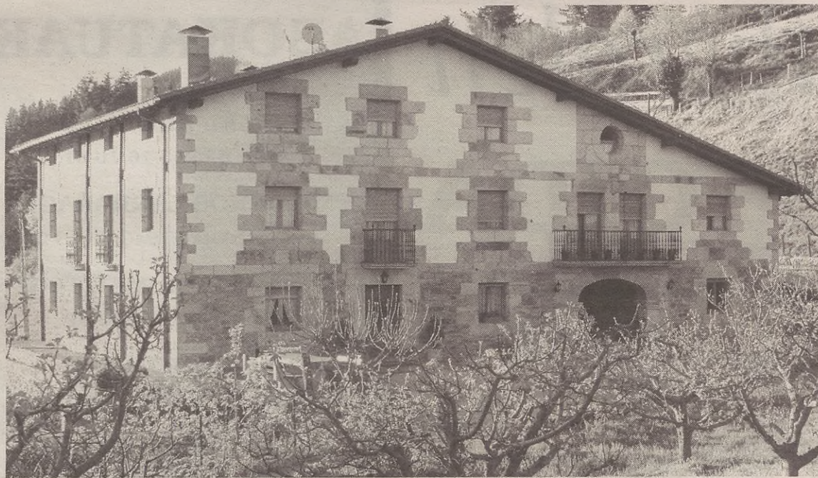
Aurrerantzean, hamasei lagunendako tokia izango du Ibarre baserriak.

Urte osoan zehar izaten dituzte bezeroak Ibarren. Horietako gehienak herriko eta ingurueta-