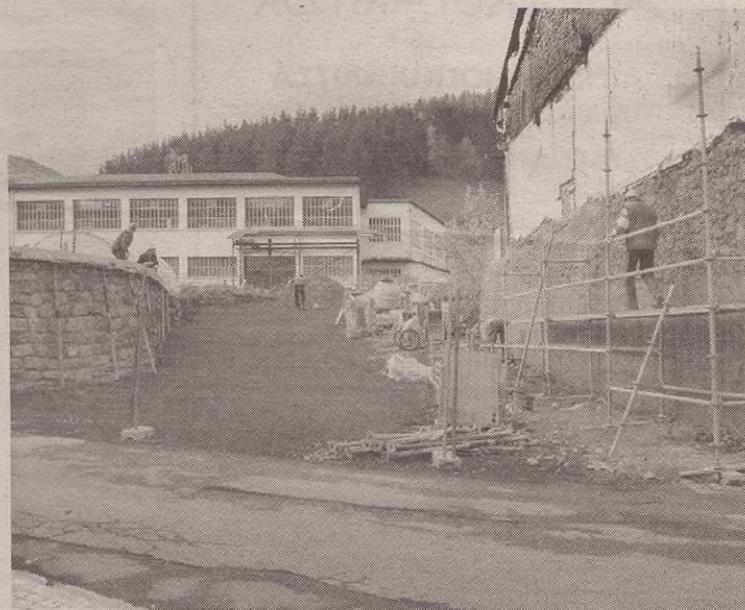
Eguaztena ezkerre zabalik dago Sagasti eta Kalegoi lotzen dituen bidea.

Aurrerantzean, noranzko bakarra izango du Buztinzurik. Oraingo, plaza aldetik Kalegoirako noranzkoan bakarrik erabili ahal izango dugu Buztinzuri. Izan ere, Talleres Antzuola izandako eraikina berritzen dihardute, eta aldazio bereziak jarri dituzte. Gero, baina, goitik behera bakarrik etorri ahal izango da.