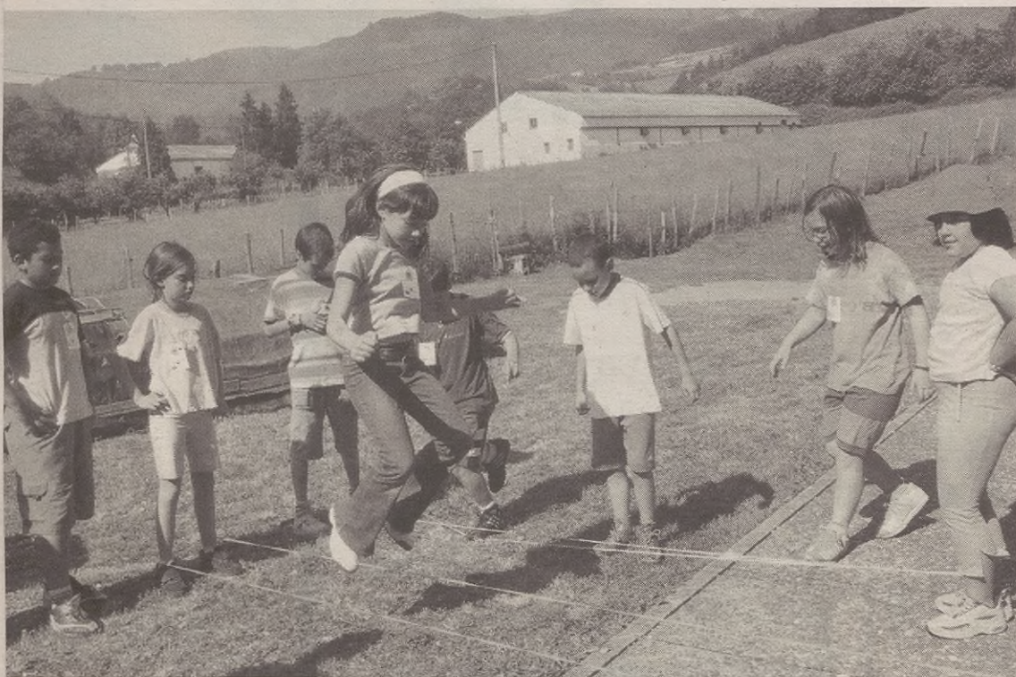
laz Aramaion ospatu zuten Joko Tradizionalen Topaketa.