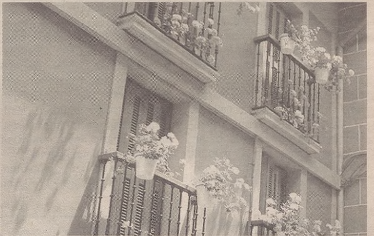
Aurora eta Alejandroren balkoia, Kalebarrenen.