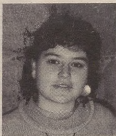
"Historia behin eta berriz errepikatzen da eta ez du inolako mugarik"

Ondoren txiletar estatuaren eraketa eman zen, ordura arte maputxeen esku zeuden lurraldeak ejerzitoak bereganatu zituen