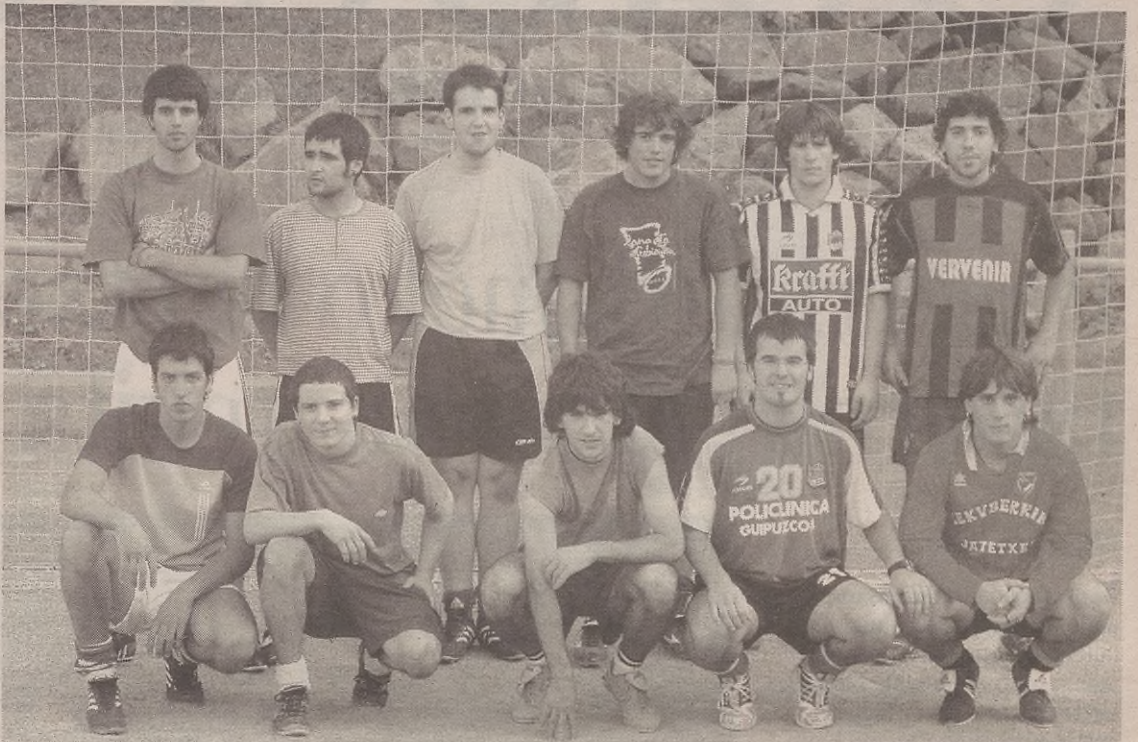
Martitzen arratsaldean egin zuen lehenengo entrenamendu saioa erregional mailako taldeak.