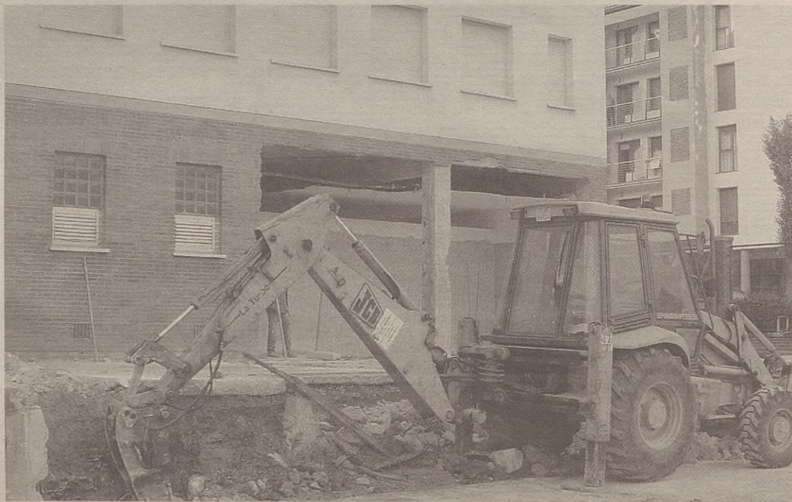
Abuztuan ekin zieten lanei, eskolak hasterako lanik handienak bukatuta izatearren.

Haurtzaindegiaren egokitzapen lanak Udalak hartu ditu bere gain; 300.000 bat euro inbertituko ditu horretan. Haurtzaindegiaren kudeaketaz eta hornikuntzaz, berriz, Haurreskolak Partzuergoa arduratuko da.