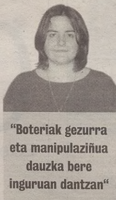
"Boteriak gezurra eta manipulaziñua dauzka bere inguruan dantzan"

lagunagan bakarrik eragiten, gizarte oso baten eragiten dabe. Boteriak, anbitu publikuak, gezurra ta manipulaziñua dauzka bere inguruan dantzan, ta askotan garaile urtetzen die, ekarriko dittuan ondorixo politiko, ekonomiko edo sozialak gezurteruari etekin zuzena badakarzkio. Gezur hauek, batzutan azaldu egiten die, ta gezurteruaren zoritxarrerako, bistaratuak