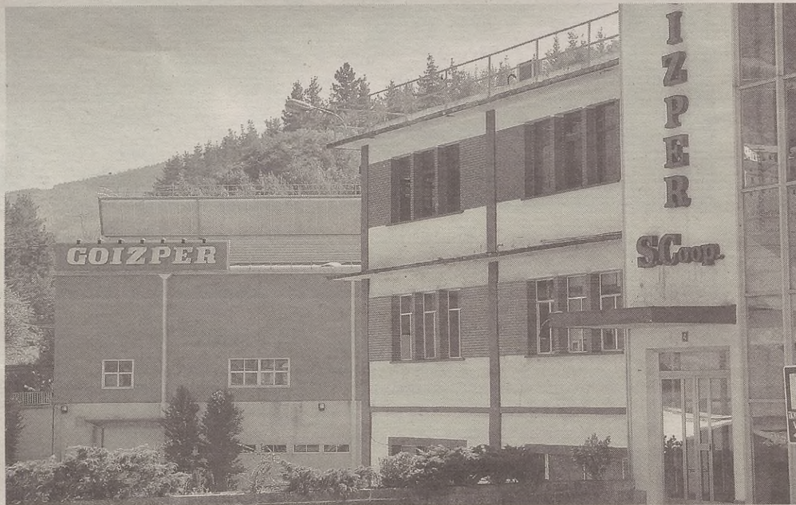
Goizperren eraikinean jarriko dute moldeak egiteko lantegia.

Orain dela hilabete batzuk joan ziren Portugalera negozio berriko arduraduna izango dena eta ekoizpen eta teknikari ardura-