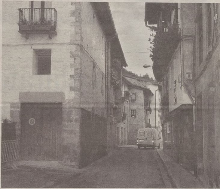
Kalebarrenetik Kalegoiraino, behetik gorako noranzkoa bakarrik izango du bideak.

Bestalde, Sagastitik Kalegoirako bidea zabaldu egingo dute; orain arte, kontrako noranzkoan bakarrik egon da zabalik bide hori. Beste aldaketa batzuk ere egingo dituzte: besteak beste, frontoitik Kalebarrenerako bidea erabat itxiko dute eta frontoiko pasealekuak eskola alderako noranzkoa bakarrik izango du.