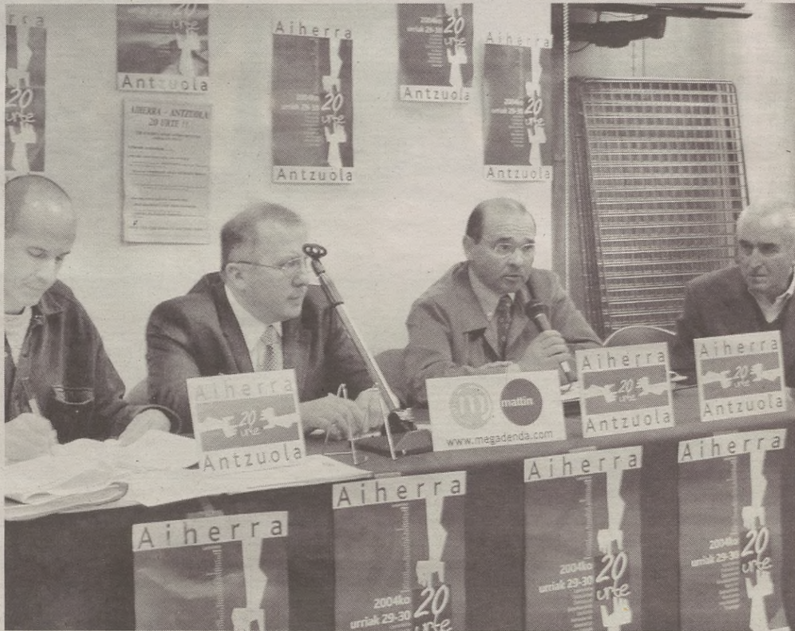
Astlehenean, hilak 18, Baionan egin zuten prentsaurrekoa Aiherrako eta Antzuolako ordezkariak.

Bestalde, aipatzekoa da kamisetak egin dituztela antolatzaileek. Bederatzi eurotan daude salgai, udaletxean eta liburutegian. Gaur, egubakoitza eta bihar Zurratègin jarriko dituzte salgai, 18:00etatik 20:00etara.