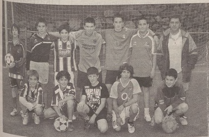
Aurreko asteburuan hasi zuen denboraldia infantil mailako taldeak.