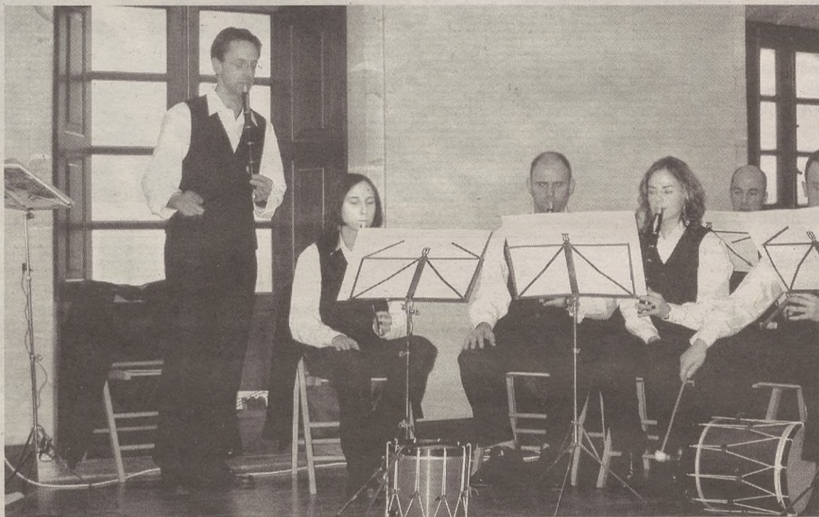
Txistulariekin batera, Antzuolako Abesbatzak eta Bergarako Metal Boskoteak parte hartuko dute.

Etzi, domeka, egingo dute aurten emanaldia, mezaren ondoren, eguerdi partean, udaletxeko osoko bilkuren aretoan.