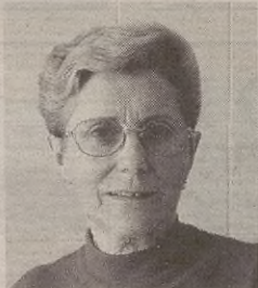
"Etxean gelditzen den emakumeak ez dauka kotizatzerik"

Eta hemen dago gakoak. Etxean gelditzen den emakumeak ez dauka kotizatzerik, ez