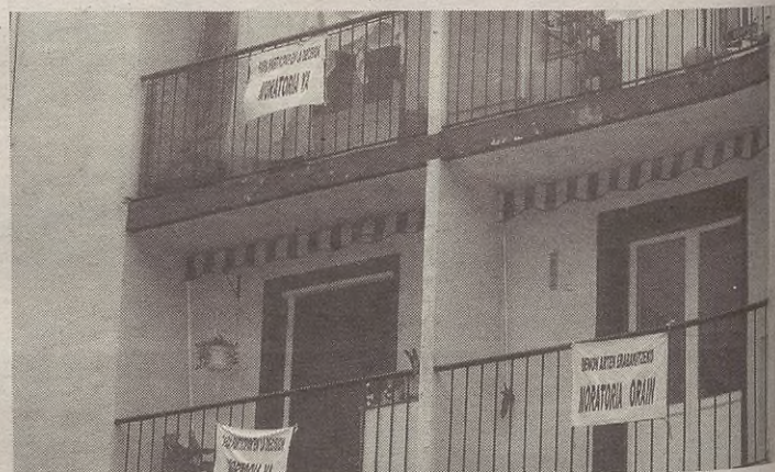
Aurreko astea ezker daude kartelak Beheko Auzoko balkoi eta leihoetan.

Auzotarrek zera adierazi digute: “Gauzak beste era batera egiteko behar direla esan nahi diogu Udalari; horrelako proiektu garrantzitsuen aurrean, denon iritzia kontuan hartu behar dela”.