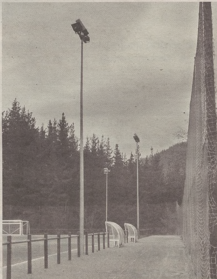
Futbol zelaiko argiak edozein herritarrek pizteko aukera izango du aurrerantzean.

Gauzak horrela, Estalarako bideko argiak piztu ahal izateko, hilerri ondoan jarri dute etengailu edo interruptorea. Sakatzen dugunetik 15 minutuz egongo dira farolak piztuta; ondoren, itzali egingo dira. Goitik behera etorri ahal izateko, berriz, futbol zelaiko aldagelen eraikinean, kanpoko horman dago etengailua.