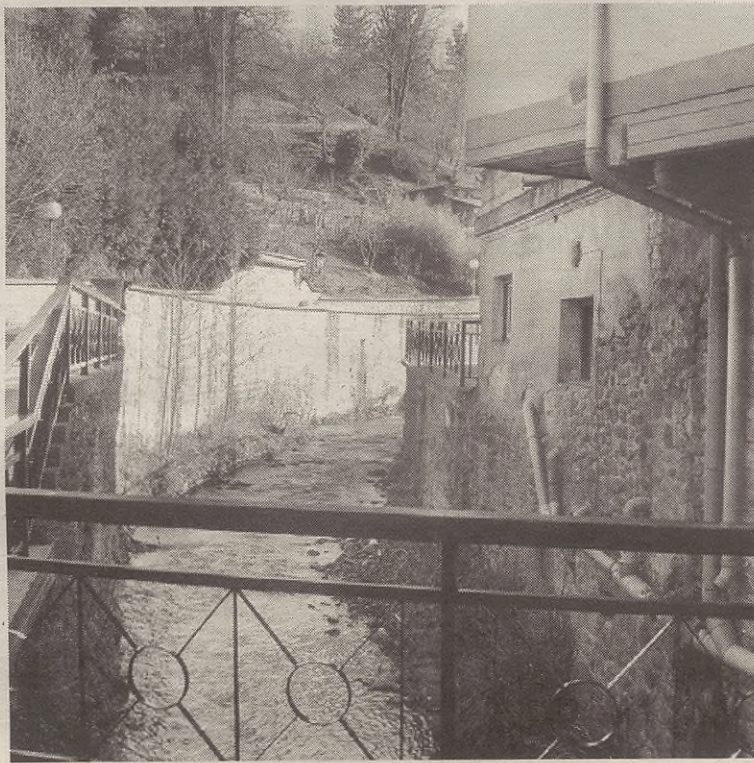
Gainezkabidea udaletxearen atzeko aldean egingo dute estalita.

Bestalde, plazan lurra altxatu eta erreka kanalizatuko dute. Kanalak lau metro eta erdiko zabalera izango du. Errekaren gainean, udaletxearen aurreko aldean, 19 metroko plataforma bat ipiniko dute eta Euskadiko Kutxaren eta Surpe tabernaren