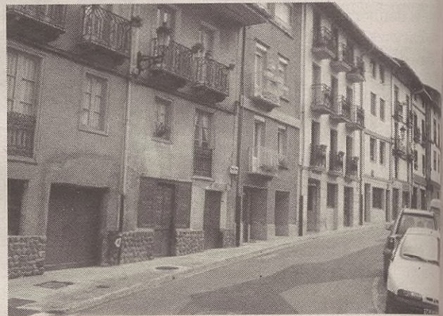
Linea berriak 13.000 voltez hornitzen ditu Antzuolako etxeak.