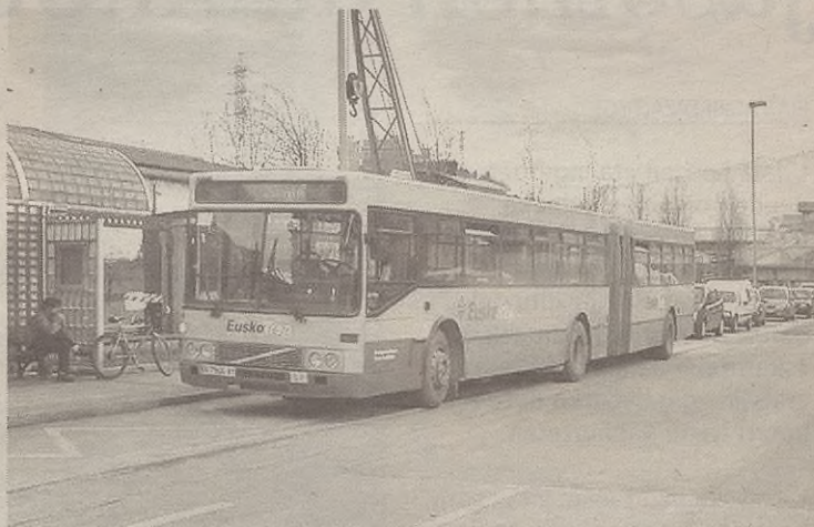
Begarakoa izango da Antzuolatik gertuen geratuko den tranbiaren geltokia.

Autobus zerbitzua zein konpainiak eskainiko duen zehazteke dago oraindik. Baina baliteke Euskotrenek hartzea bere gain.