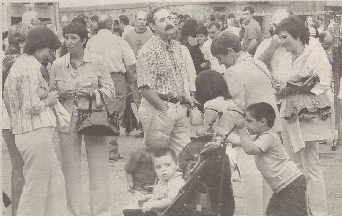
Urte hasieran 2.043 biztanle zituen Antzuolak; orain dela bost urte baino 147 gehiago.

Biztanle kopuruak gora egitearen arrazoietakoa bat da jendea kanpotik Antzuolara etortzea bizitzera. Bost urteotan 313 lagun etorri dira. Batzuk ingurukoak, Espainiako hainbat txokotakoak besteak, eta Espainiatik kanpoak ere: Pakistan, Errusia, Argentina, Mexiko, Kolombia, Portugal eta Errumaniatik, guztira 19. Kanpotik jende gehien izan zuten, 121, hain zuzen ere.