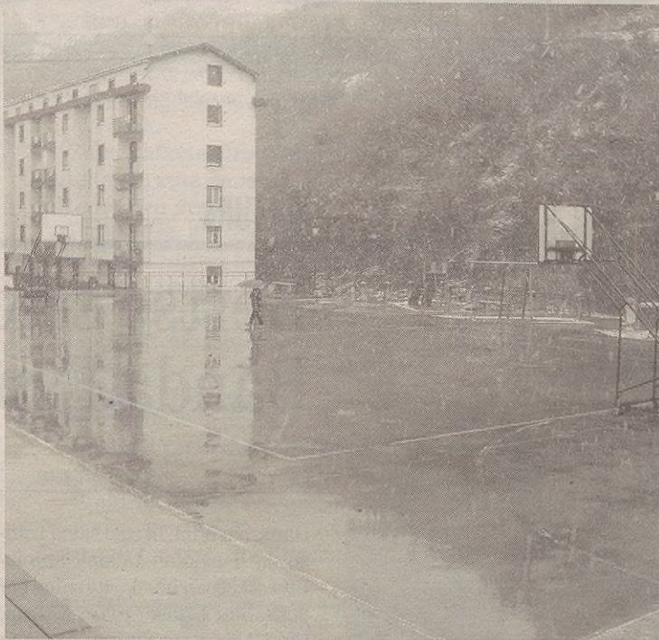
Gaur egun jolaserako erabiltzen den plaza gorrian egin nahi dituzte etxeak.

Hori dela eta, euren kexa azaldu zuten, baina "Udalak ez du interesik azaldu auzokoekin hitz egiteko", esan dute. Herritarren partaidetza beharrezkoa dela gaineratu dute: "Gure hitza entzunda edozein aldaketa adostasun maila handiarekin egin ahal izateko. Kalitatezko herria, bizi-baldintza egokienak eta benetako partaidetza demokratikoa ditugu jokoan".