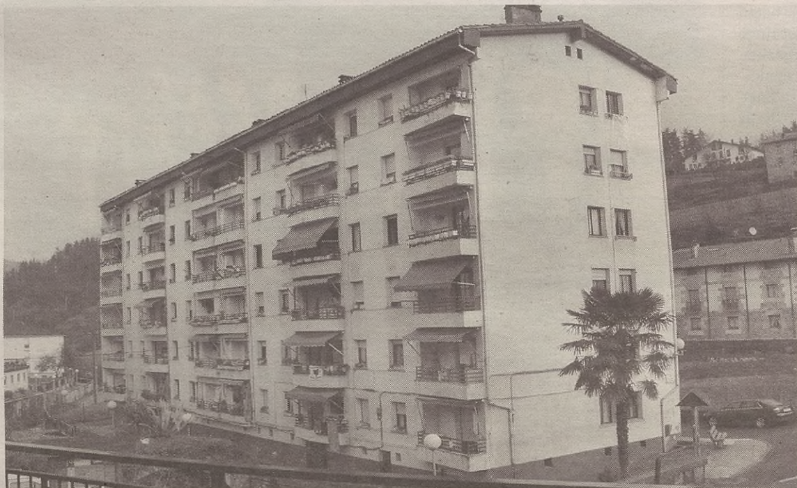
Ibarre auzoa urbanizatzen inbertituko dute diru gehien, 270.371 euro, hain justu.

Aipatzekoa da, bestalde, Nekazaritza batzordeak ere inbertsioen zati handi bat eramango duela aurtengoa, 96.643 euro, hain zuzen ere.