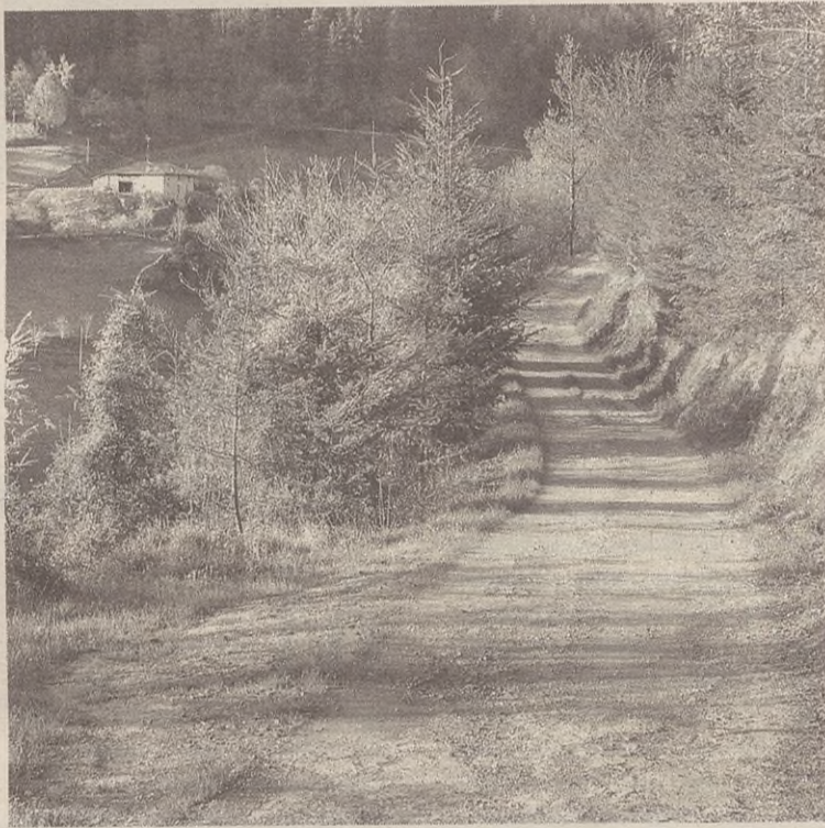
Kilometro eta erdiko bidea dago Urruti baseritik Gorrizera.

Legealdi hasieran, Nekazaritza batzorde berria osatu zutenean, hurrengo lau urteetarako plangintza egin zuten. Lehendabiziko urtean Basalden egin zituzten