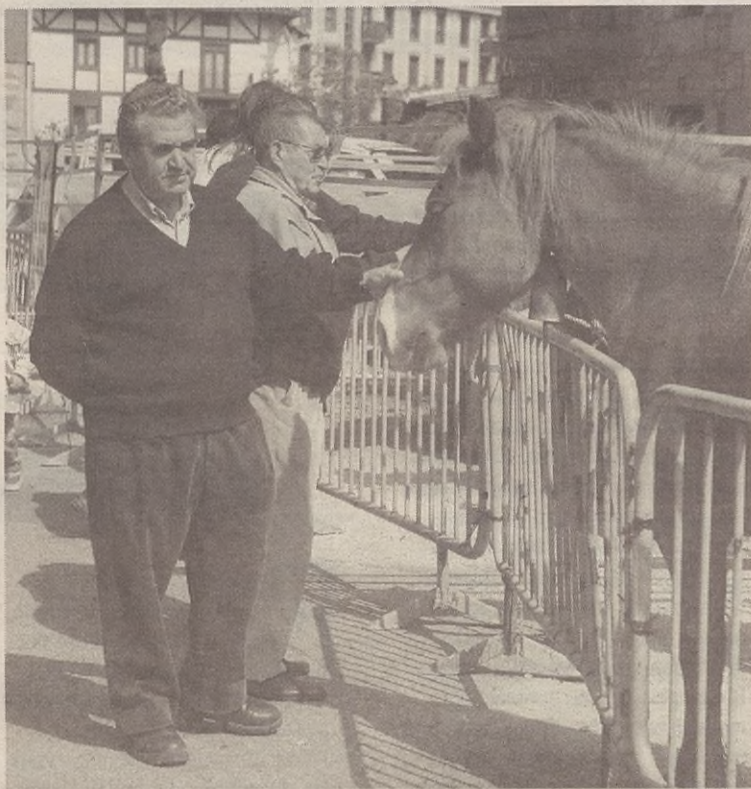
Ganaduak eta artisau postu mordoia jarriko dituzte zapatu goizean zehar.

10:30ean salda banatuko dute Trekutz elkarrean; 11:00etan izango da meza. 12:00etan, txistulariek kalejira egingo dute eta 12:30ean, trikitalarien kalejira izango dugu.