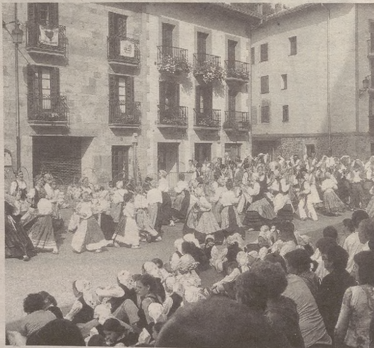
Bi urtetik behin antolatzen du Umeen Dantzari Eguna Oinarin dantza taldeak.

Goiz parteko dantzaldia 12:30ean izango da, Herriko Plazan. Talde guztiak batera dantza egingo dute. 13:30ean bazkaltzera joango dira guztiak, eta 17:30eko dantza saioarekin bukatuko dira ekitaldiak; talde bakoitzak bere dantzak eskainiko ditu.