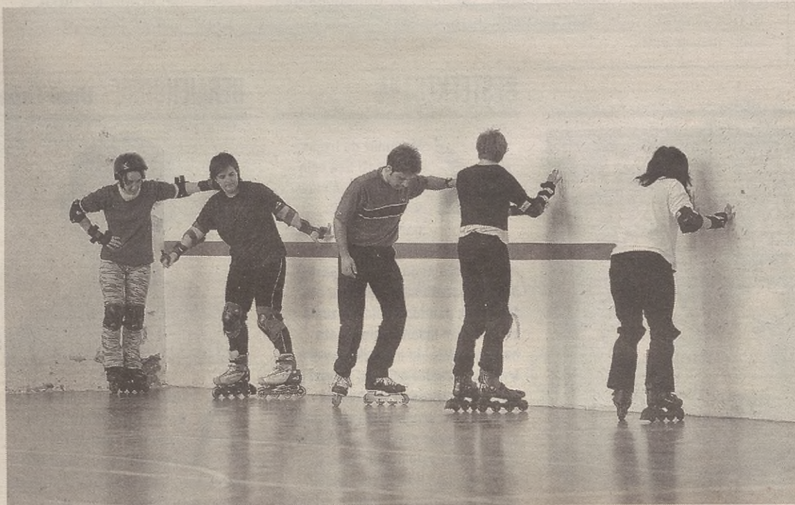
Uztailean izango dira antolatutako kirol jarduerak guztiak.

Helduendako, bestetik, patinaje, aerobik eta gimnasia ikastaroak egongo dira. Bi txanda egongo dira: uztailearen 1etik 14ra