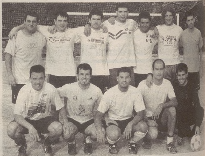
Antzuola, Angiozar eta Bergarako hemeretzi jokalarik osatzen dute Angiola taldea.

Aipatzekoa da, bestalde, Angiola den arren Ipintzako txapelketan diharduen herriko talde bakarra, Antzuolako jokalaririk ugari dabiltzala txapelketa horretan parte hartzen, Bergarako taldeetan.