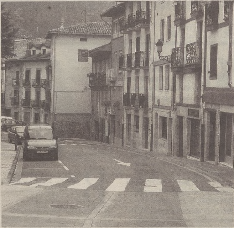
Urtea amaitu baino lehen hasiko dituzte Buztinzuriko lanak.

Gero, Kalebarren, Herriko Plaza eta Ondarre geratuko dira egiteko. Herriko Plazako lurzorua eta azpiegiturak berritzeko