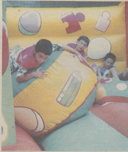
UMEENDAKO JOLASAK IA EGUNERO.

09:55 TXUPINAZOA. 10:00 Txistulari taldearekin GOIZ-ERESIA. 11:30 BERGARAKO UDAL MUSIKA BANDAREN KALEJIRA. 11:30-13:30 ESKULAN TAILERRAK herriko plazan, Arrasateko Txatxilipurdi aisialdi taldearen eskutik.