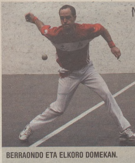
BERRAONDO ETA ELKORO DOMEKAN.

12:30 BERGARAKO UDAL MUSIKA BANDAREN KONTZERTUA Zurrategin. 18:00 Mairuaren ALARDEA. 19:00 Oinarin taldearen DANTZA SAIOA. 19:30 HERRI KIROLAK Zurrategin. 20:00 PRESOEN ALDEKO EKITALDIA Zurrategin. 21:00-22:00 JOSELU ANAIAK taldearekin, DANTZALDIA. 21:30 HERRI AFARIA, txosna batzordeak antolatuta Zurrategin. 23:00 KONTZERTUA, txosna-gunean. 00:00 SUZKO ZEZENA, herriko plazan. 23:00-02:00 JOSELU ANAIAK taldearekin, DANTZALDIA.