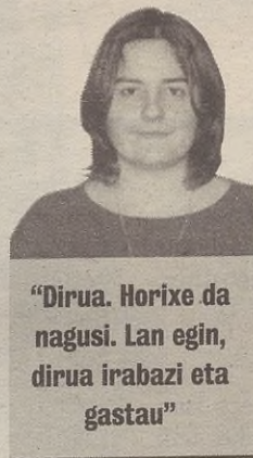
“Dirua. Horixe da nagusi. Lan egin, dirua irabazi eta gastau”

Batez be, gastatziak statusa emuten dabelako. Askotan