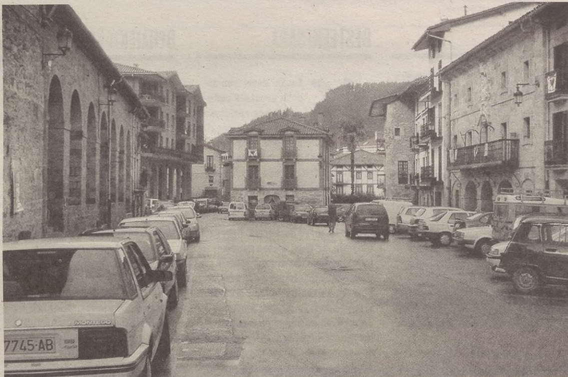
Tokiko Agenda 21 proiektuan udalerritaren garapen iraunkorraren oinarriak ezarri behar dituzte.

Prospektiker aholkularitza zerbitzuak kudeatzen ditu Antzuolako foro edo batzarrak eta