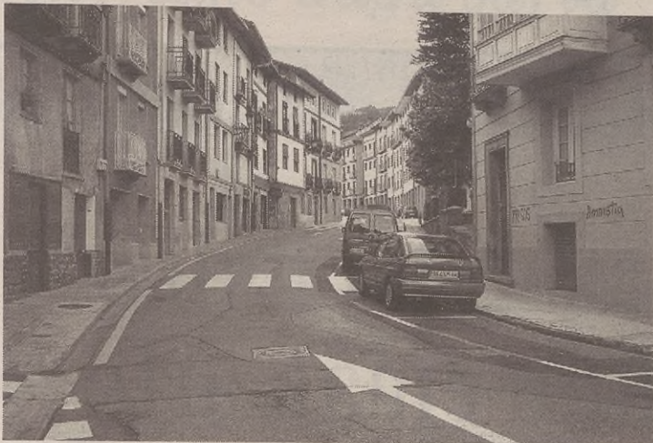
Azaroan hasiko dituzte lanak eta bi hilabetez egongo da itxita Buztinzuri kalea.

Buztinzuri kalean azpiegitura guztiak eta lurzorua berritzeko lanekin hasiko dira azaroan. Udaleko arduradunek espero dute bi hilabeteko epean, urtarrilerako, lanok amaitzea. Bi hilabete horietan Buztinzuri kalea guztiz itxita egongo da ibilgailuendako.