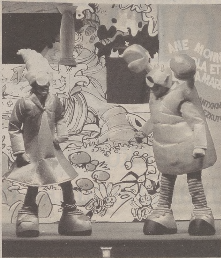
Hiru eta hamaika urte bitarteko umei zuzenduta dago antzezlana.

Antzezlanean protagonistak dira Amama Pantxika, Mister Kaskarin gaiztoa, Moko Beltz eta Moko Oker txoriak eta Maddalen, besteak beste. Hiru plano ezberdinetan azaltzen dira pertsonaiok: txotxongilo gisa, tamaina naturallean eta pantaila baten.