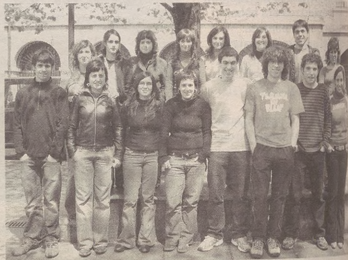
Elkar Heziko batxilergoko bigarren mailako ikasleek dute ihardunaldien ardura.