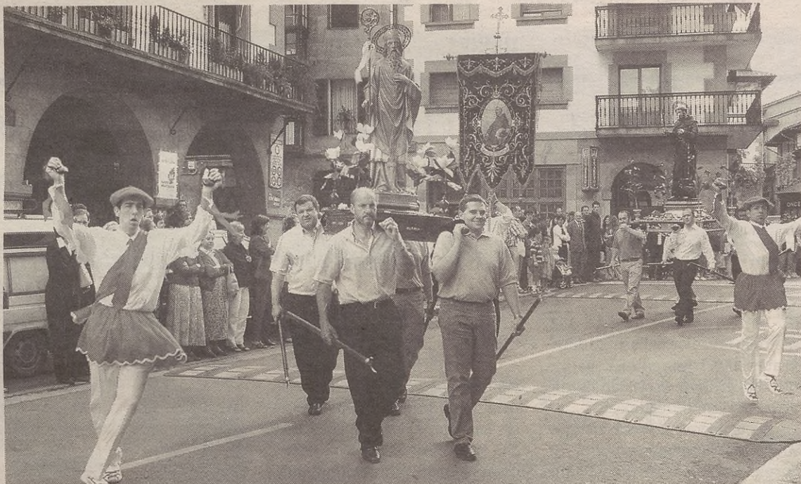
Gorpuzti eguneko prozesioa domekan izango da herriko kaleetan.

Gorpuzti eguneko prozesioa domekan egingo dute aurten ere. Meza nagusiaren ostean hasiko da eta betiko ibilbidea izango du. Arratsaldean, berriz, urteroko dantza ikuskizuna eskainiko du Oñatz dantza taldeak plazan.