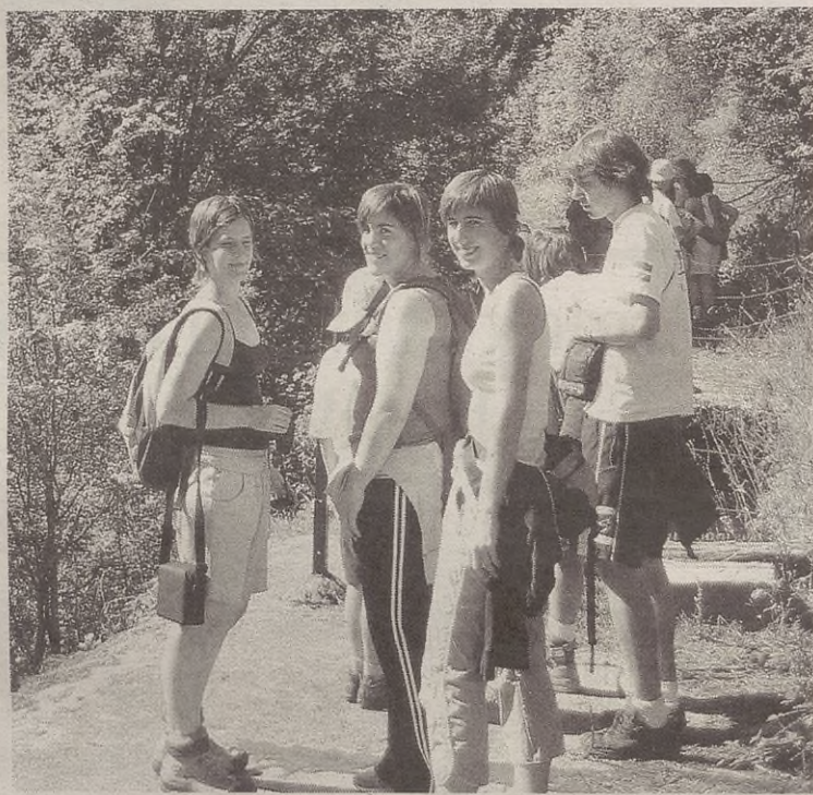
Orkatzategiko hegazti kolonietara egindako irteera.

Lau ordu inguruak dira ibilbide batzuk eta egun osoak beste batzuk. Natur Eskolako kide-