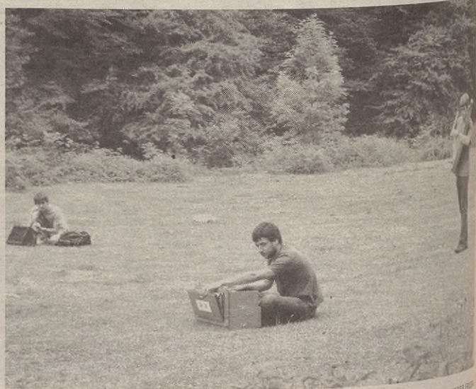
Iturrigorriko zelaietan bat egin zuten musika instrumentuak eta naturaren soinuek

Gandiagaren poemak ulertzeko geldialdiak egin zituzten bidaiak eta Iturrigorri, albokak, txakrolak, ordenagailuak eta beste instrumentuak atera eta eromeria egin zuten: soinuak entzun eta eurekin gozatu.