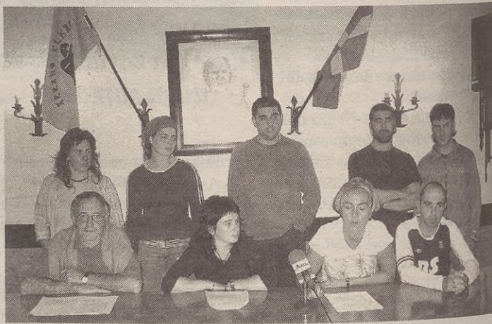
Batasuna, Ereitten, LAB eta Askatasuneko ordezkariak zeuden prentsaurrekoan.