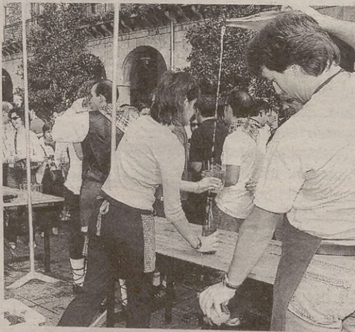
Gipuzkoako 22 sagardotegi egongo dira plazan.

Eguerdian herri bazkaria egingo dute Zubikoan eta herri kirolak arratsaldean.