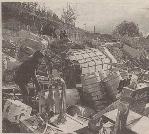
Horrelaxe gelditu da gaztetxea zena.

Bi hilabete pasatxo egon da zabalik Oñatiko gaztetxea eta tarte horretan hainbat bilera ere egin dituzte Gazte Asanbladako eta Udaleko kideek. Joan den martitzen goizean hondeatzeko makinak sartu ziren eta eguerdia heldu baino lehen bota zuten gaztetxea behera. Orduan ez zen arazorik egon baina izan dira istiluak harrez gero.