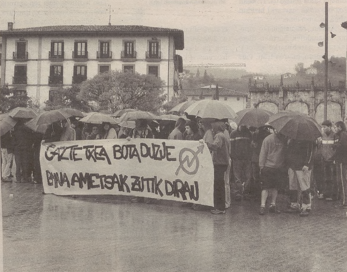
Eguazten eguerdian kontzentrazioa egin zuten gazteek plazan, manifestazioan erabili zuten lelo berdinarekin.

Zazpitan abiatu zuten manifestazioa. Plazan sartu zirenean arrautzak bota zituzten gazte batzuk udaletxearen aurka eta atzeko kaletik gora joan ziren gaztetxearen alde manifestatzen. Erdiko kaletik behera etorri zirenean, ordea, ertzainak zituzten zain plazan. Arrautzak jaurti zituzten berriro gazteek udaletxearen aurka eta ertzainek gomazko pilotak bota zituzten