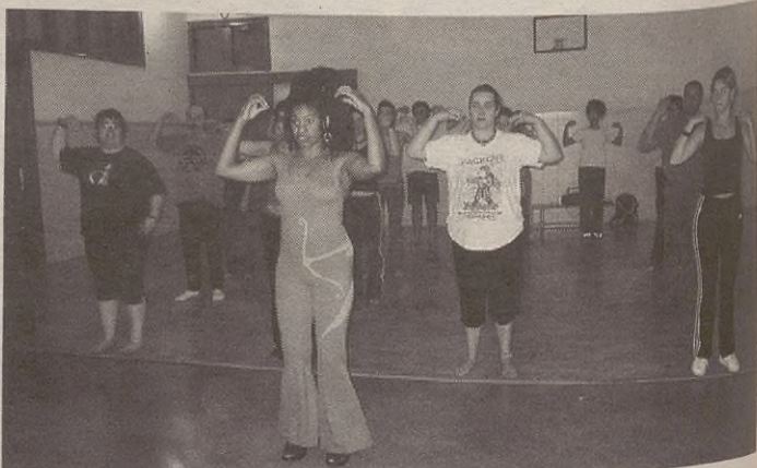
Tailer hauen ostean gehiago antolatzeko asmoa ere badute Gaztelekuan.

Ikastaroetan izena emateko epea dagoeneko zabalik dago. Plazak mugatuak dira. Gehienez 20 laguneko taldeak egingo dituzte. Interesa duenak, Gazte Informazio bulegoan eman behar du izena aste barruan, 10:00etatik 13:00etara edota 17:00etatik 20:00etara. Telefonoz edo e-postaz ere egin daiteke.