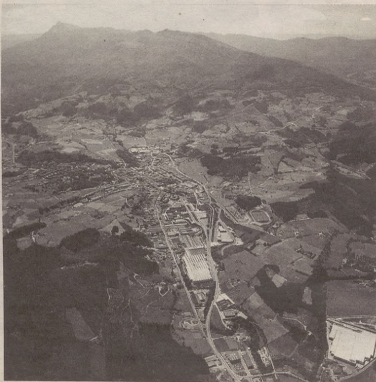
Inaugurazioak bultzada emango dio CUT proiektuari.

Ekintza puntualak ere iragarri dituzte Oñatin 2006rako, hala nola: Mundumira jaialdia, Euskal Eskola Publikoaren jai eta Aita Madinaren urteurrena.