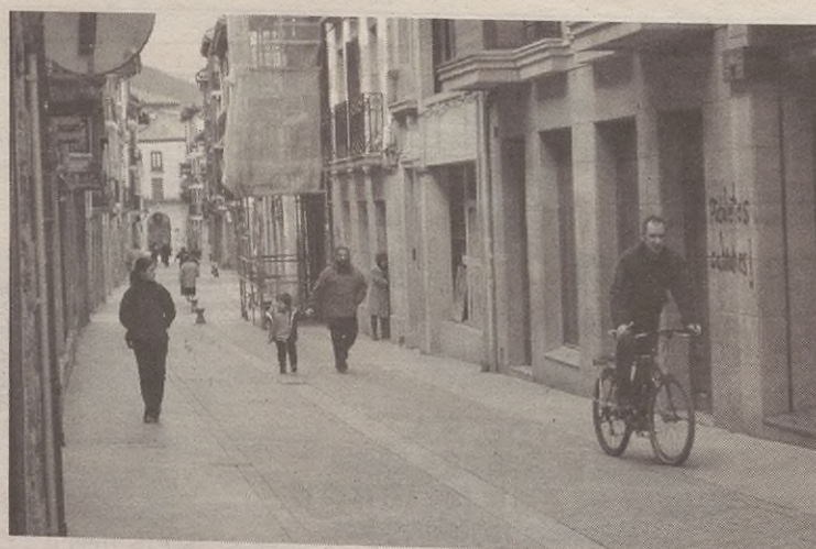
Mugikortasunari buruzko mahai-ingurua zabala da eta guztiak daude gonbidatuta.