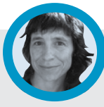
Pili Gartzia Suhiltzailea

Memoria kolektibo laburra dugu eta geroan gutxi pentsatzen dugu. 1834. urteko ekainean, Deba bailarak uholde bortitz bat jasan zuen. Horrelako datuak kontuan izan gabe, ibai-ertz eta gainak okupatu dira, interes ekonomikoak guztiaren gainetik lehenetsiz. Klimak zer egingo duen ikertu daiteke, baina, gizakiok lurrari egiten dizkiogun kalteez gain, naturak dena suntsitu eta berritu dezake.