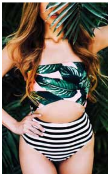
Trikini baten adibidea.

Udaberrian tendentzia izan diren modek eragin zuzen-zuzena izan dute udan eramango diren bainujantzien diseinuetan. Hori kontuan izanik, hondartzetan eta igerilekuetan gailenduko direnak honako diseinu hauek izango dituzte: alboetan korapiloak dituzten bainujantziak, off the shoulders deritzenak, bardot eskotea dutenak, kolore bizikoak, asimetrikoak, loredun eta vichy laukien estanpatuak dituztenak eta, nola ez, bolantedun bainujantziak. Dendetan aurkituko ditugun bainujantzien diseinuak asko eta era askotarikoak dira, eta, horregatik, emakume bakoitzak bere gustu eta gorputzera ondoen egokitzen den bainujantzia hautatzeko aukera paregabea izango du uda honetan.