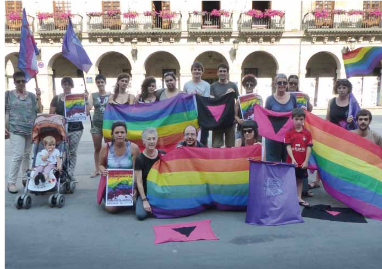
Debagoieneko Koordinadora TransMarikaBolloFeministak ekainaren 28ko mobilizazioetan parte hartzea deitu ditu herritarak.

“Aurreko urtean Arrasaten landu genuen sexilioaren gaia, eta manifestazioa ere egin genuen. Arrakastua izan zen, ez genuen espero, gazte pila bat batu ziren. Emandako irudia oso potentea izan zen, eta ea aurten marka hori gainditzen dugun. Horregatik, intentzioa herrietatik jendea Bergarara mobilizatzea da. Oso garrantzitsua izan da feministekin lortu dugun