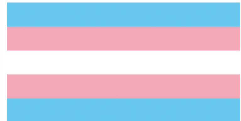
Trans harrotasunaren bandera.

Transfobiatik ihesi Gurean ere beste herrialde batzuetatik transfobiatik ihesi datozen pertsona ugari daudela azaldu du bergararrak: “Naziotasunik gabeko pertsonen eskubideak bermatzea, transfobiatik edota homofobiatik ihesi datozen errefuxiatuei asilo eskubidea bermatzea eta izena zein sexua zuzentzeko eskubidea ez ukatzea. Gero eta gehiago ikusten da, gainera, haien herrietan mehatxuak eta hilketa saiakerak izan dituztelako. Toki dezente daude nazioartean oraindik, eta hemen babesik gabe daude”.