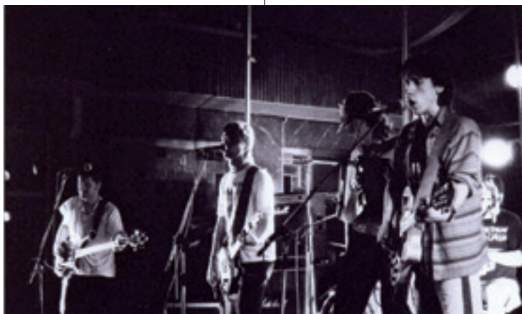
Hor Konpon taldearen hasieratan, Azkoitiko plazan eskainitako kontzertuan.