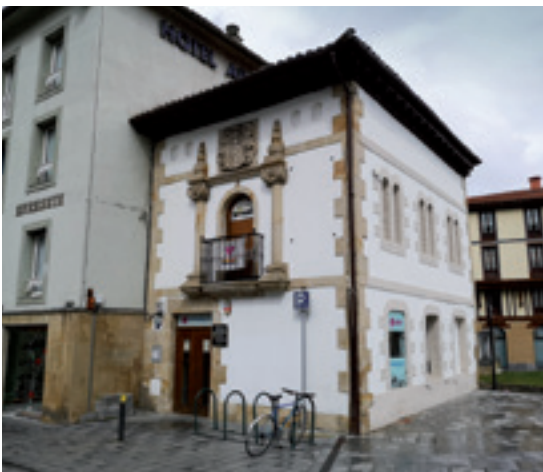
Esteban Garibai jaio zen etxea.