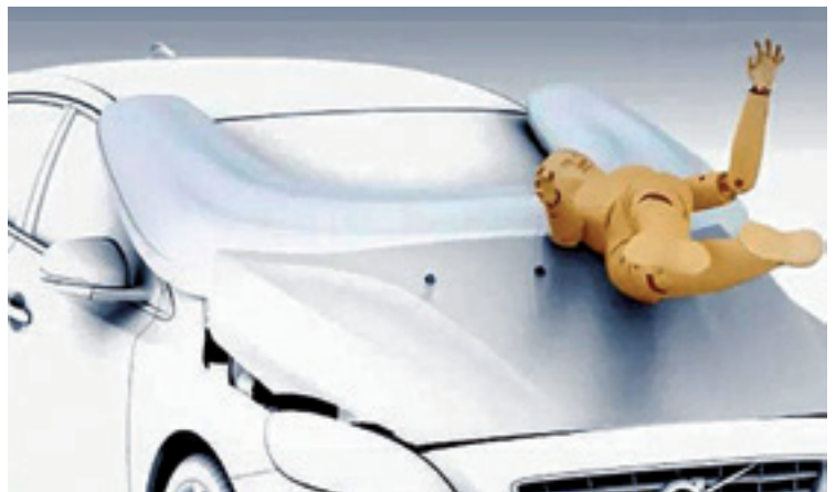
Volvo auto ekoizle suediarrek oinezkoentzako airbagak erabiltzen ditu.

Suediako Volvo izan da azkenaldian teknologia horretan berrikuntza gehien garatu dituen etxeetako bat. 1994an, adibidez, alboko airbaga ezarri zuten 850 modeloan, bidaiariek alboko kristalaren aurka talka egitean kolpeak leuntzeko. 2012an,