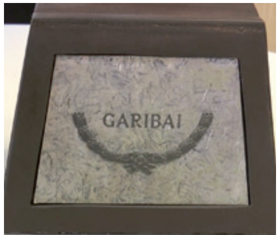
Garibairen omenezko monumentuaren plaka.