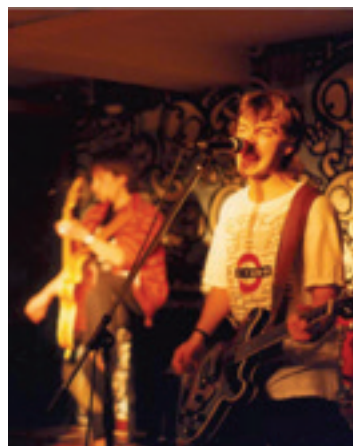
Lasarteko Zulo aretoan, 1993an.