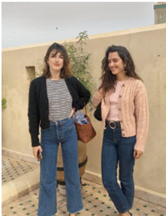
Gerri altua duten prakekin.