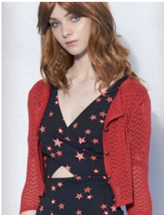
Zulo-puntudun errebea, soinekoarekin.