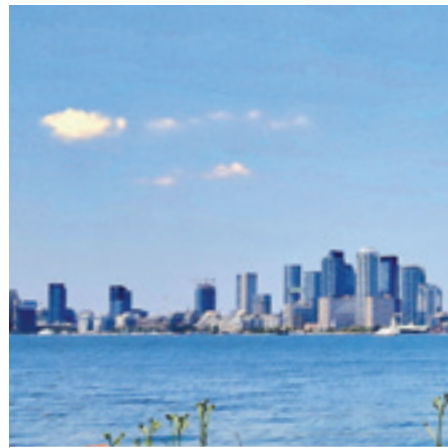
Torontoren bereizgarrietako bat dira etxe orratzak.

BIGARREN ALDIA DUT KANADAN; NATORREN BAKOITZEAN TXUNDITUTA UZTEN NAU HERRIALDE HONEK