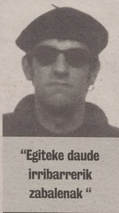
"Egiteke daude irribarrerik zabalena"

zokondo guztietan sartzen da, itsugarria izateraino. Badira hiru edo lau aste txoriak gaueko hamabietan hasten direla kantuan Florida parkeko zuhaitz tantaletatik, argitasunaz gogaituta edo. Eta pertsonok ere aspertu egiten gara askotan hainbesteko argiz, ikusi beharrekoak baitira jendearen aurpegiak kaletik pasatzerakoan: nazka, tipulabegiak, begira odolduak. Apokaliptik hurbilen dagoen hiria da