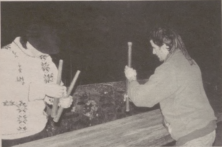
Besteak beste, txalaparta ikastaroa izango da, Txirritolaren eskutik.