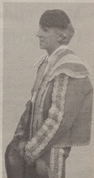
Zezen bila ibili denik ere bada.