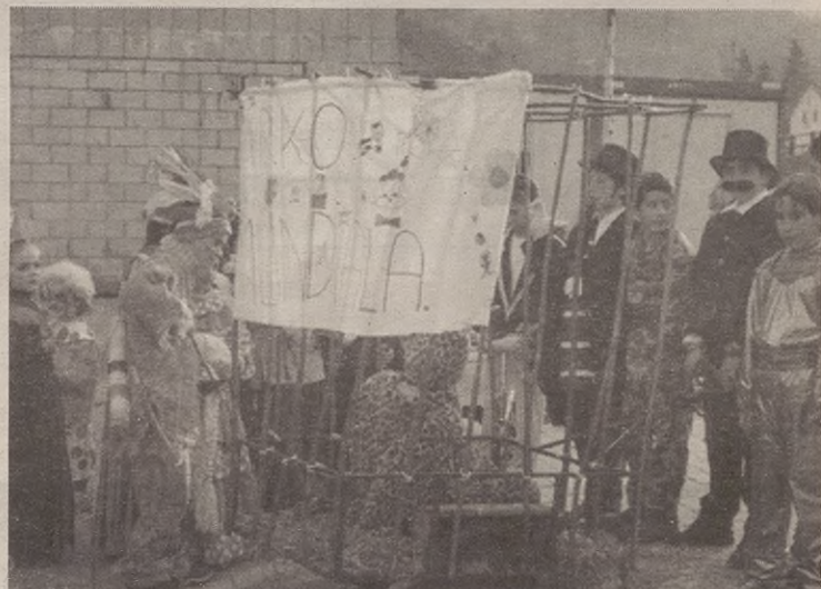
Eta hara zer-nolako zirko bikaina aurkitu genuen kalean!