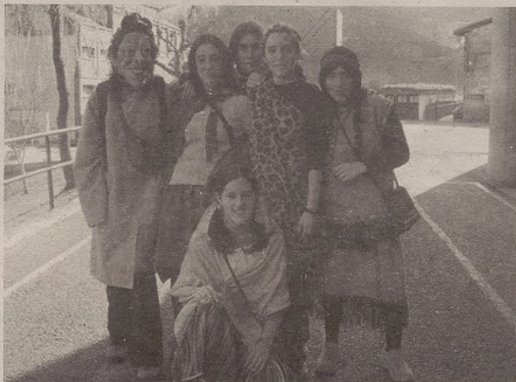
Erdi lotsatuta, baina mozorroa erakusteko gertu izan da jendea.

San Martin Eskolan, umeez dantzaldia, aerobica, jolasak eta txokolate jana izan zuten