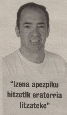
"izena apezpiku hitzetik eratorria litzateke"