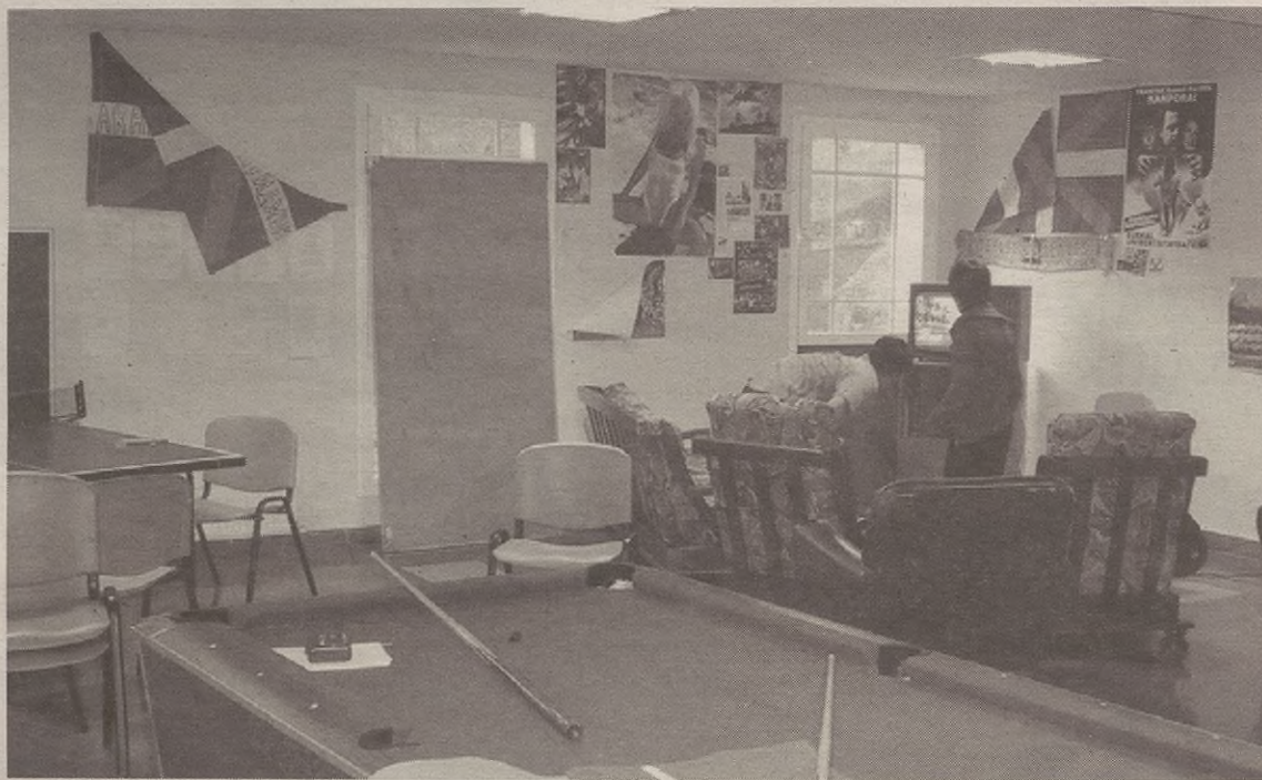
Herrian dauden lokalak gazte guztien artean erabili beharko litzukete, Udaleko Kultura zinegotziaren ustez.