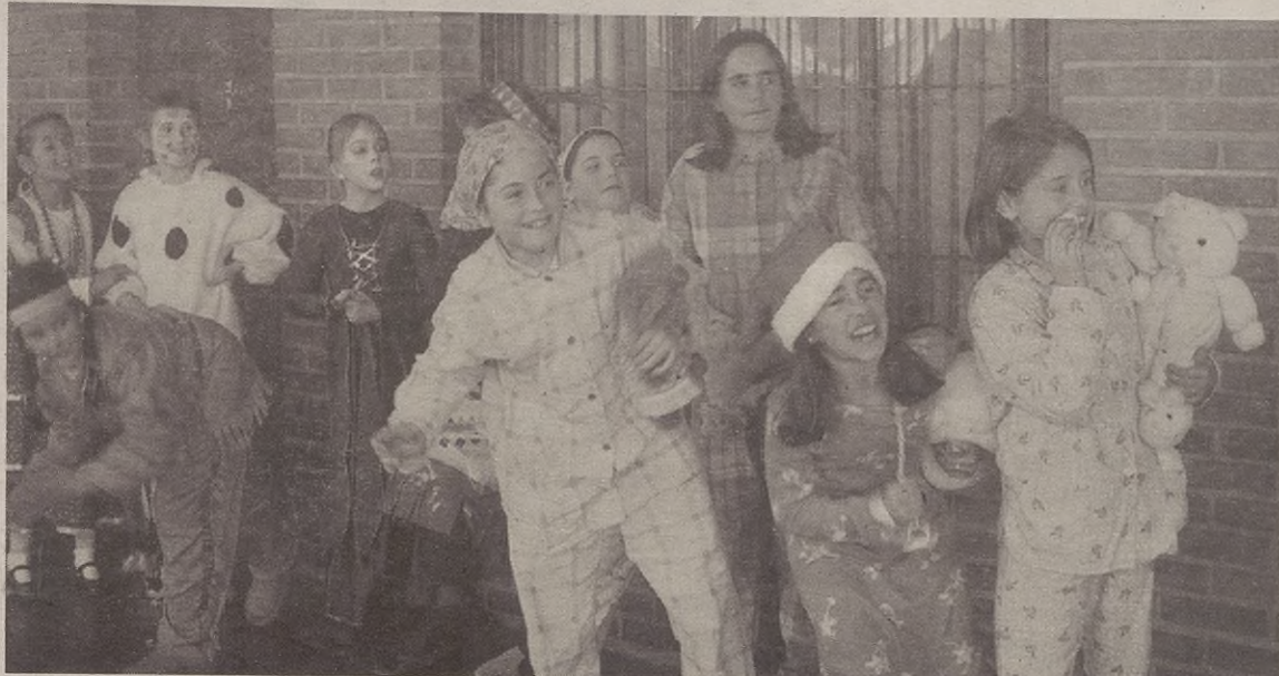
Jai giro aparta izan zuten martitzenean San Martin Eskolan.

Aramaioarrei umorerik ez zaie falta jaiak ospatzeko orduan, eta hori berori egin zuten zapatuan eta martitzenean: mozorroa soinean jantzi eta kalera! Batzuek zirkoa ikusi ei zuten herriko kaleetan eta Karlos Argiñano ere gertu ibili ei zen bere eusko labeldun barazkiekin. Aramaioarrek bata zein bestea saritu zituzten zapatuko lehiaketan. Martitzenean, berriz, San Martin Eskolan izan zen jai: dantzaldia, aerobica, jolasak eta txokolatea. Ikusten den moduan, aurtengoz bapo eginda, datorren urtera arte agur esan behar aratusteei.