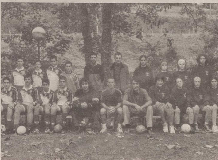
Beheko argazkian, Bañera K.Eko futbito taldeak.